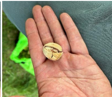
Noisettes en coque et amandon