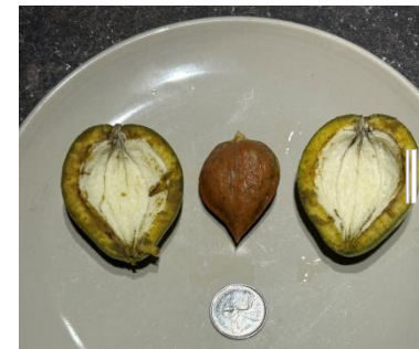
Noix - noyer de cœur avec brou fraîchement cueilli (gauche) et 24 h plus tard (droite)