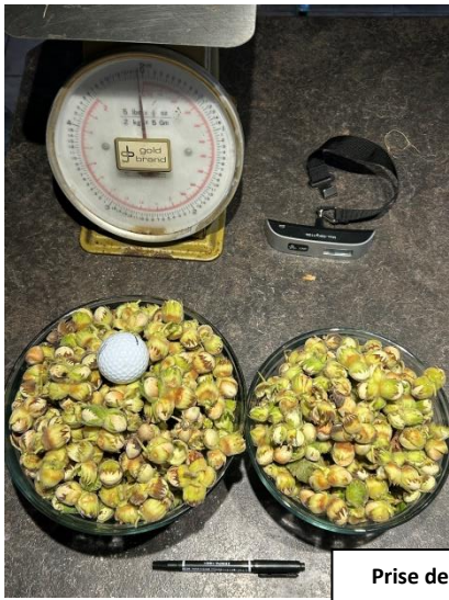
Prise de données