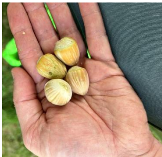
Noisettes en coque