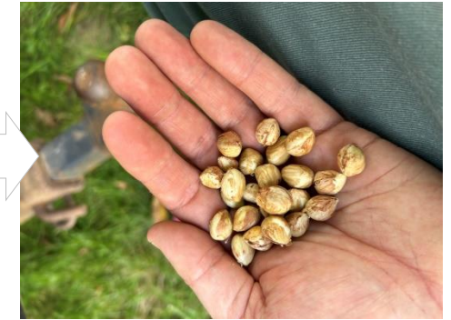
Amandons de la noisette