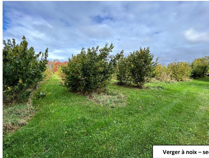
Verger à noix – secteur noiseraie - 2022