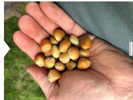
Noisettes en coque