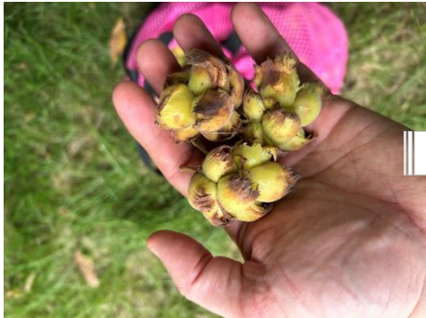
Noisettes avec involucre