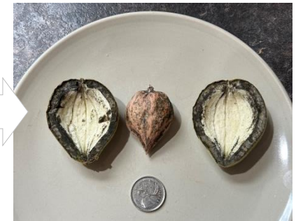
Noix - noyer de cœur avec brou fraîchement cueilli (gauche) et 24 h plus tard (droite)

Verger à noix / pépinière familiale de petite envergure Passez vos commandes rapidement au : VergeranoixLapointe@gmail.com